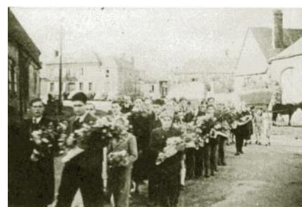
Le 4 octobre 1944, funérailles de Ian Bazalgette, à l'église de Senantes