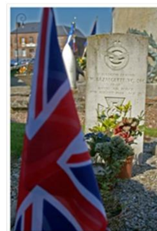
Tombe de Ian Bazalgette, cimetière de Senantes