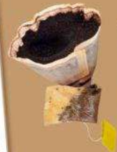
Marc de café, Sachets de thé, mouchoirs usagés