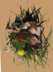
Déchets verts, tontes de pelouse, feuilles