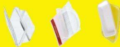
Barquettes en polystyrène et en polystyrène