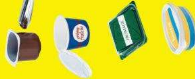
Pots et boîtes en plastique