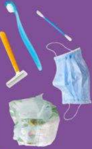
Couches, lingettes, masques à usage unique et autres déchets d'hygiène