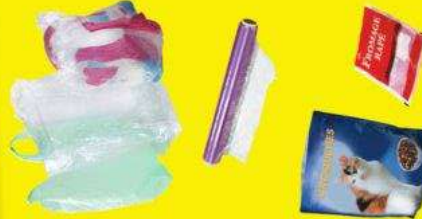
Films, blisters, sacs et sachets en plastique